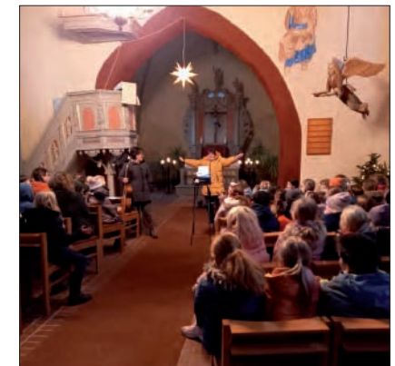
Weihnachtssingen mit Silke Jung