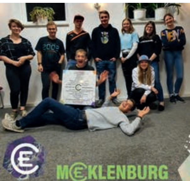
Jugendkreis LKG Wismar.

Wir - der EC Wismar - sind absolut motiviert. Vor knapp vier Monaten ging es richtig los. Seitdem treffen wir uns immer mittwochs, haben dort Gemeinschaft mit anderen Jugendlichen, hören auf Gottes Wort und verbringen einfach eine richtig gute Zeit miteinander.