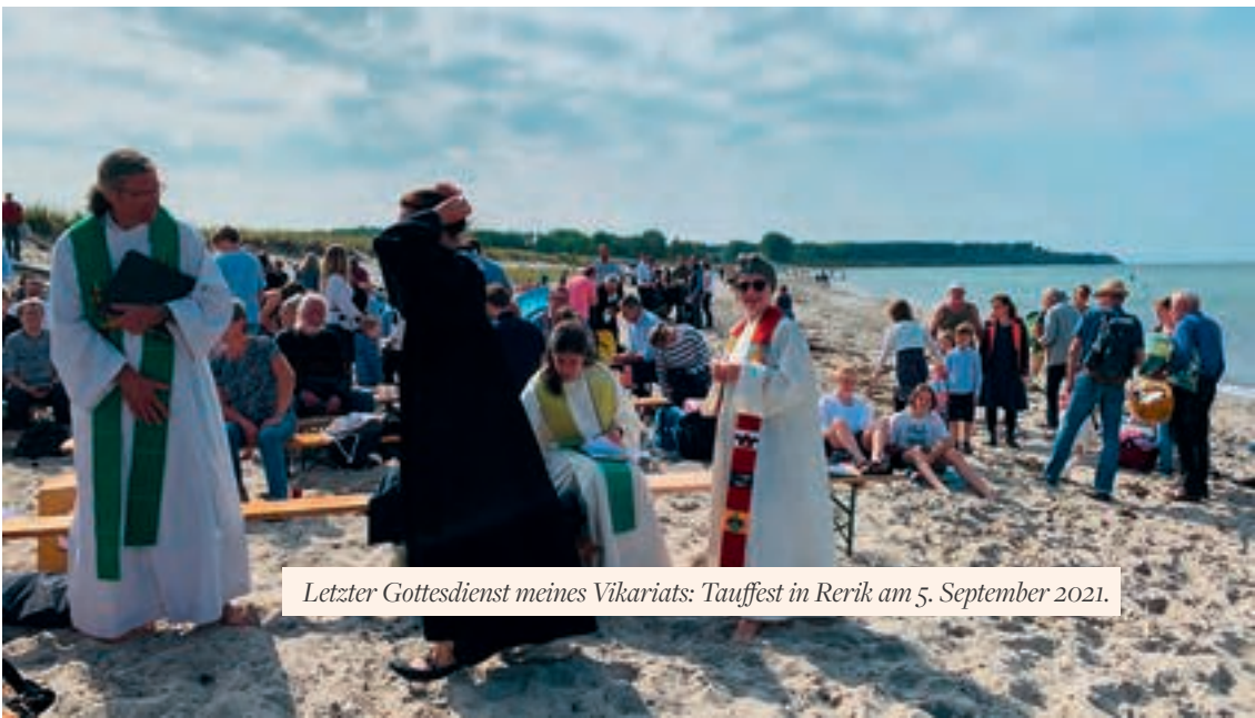
Letzter Gottesdienst meines Vikariats: Tauffest in Rerik am 5. September 2021.