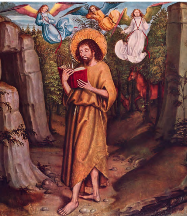
Johannes d. T. in der Wüste, Gemälde des Berner Nelkenmeisters, um 1490 (Kunsthau Zürich)

Auch in diesem Jahr geht es wieder nach Dreilützow. Wir werden aber in kleinerer Runde im Verwalterhaus auf dem Schlossgelände untergebracht sein. Eingeladen sind Familien, Paare und Einzelpersonen aus dem Gebiet der Kirchengemeinden Wismars und Proseken-Hohenkirchen. Wir beginnen die Freizeit am Johannestag und wollen uns thematisch mit Johannes dem Täufer beschäftigen: Ein Mann im Kamelhaarmantel, der sich von Heuschrecken ernährte und unbequeme Wahrheiten aussprach, und doch strömten die Menschen zu ihm. Es wird Gelegenheit sein zu Austausch und Begegnung, zu Spiel, Andachten und Glaubensgesprächen.