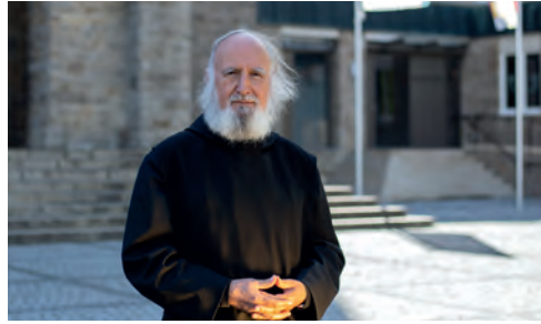
Pater Anselm Grün.

Mut zur Entscheidung, Vortrag von Benediktinerpater Anselm Grün 29. April, 19.30 Uhr in Heiligen Geist