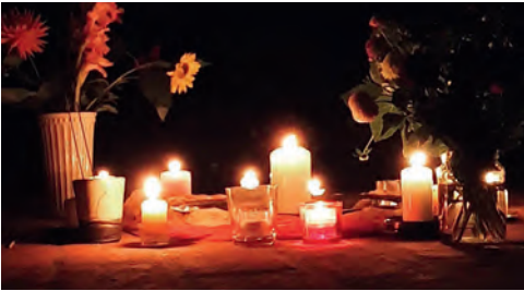
Georgenkirche | Kerzenkreis.

Im November war Monika Schaugstat zum „Märchenabend: Das hässliche kleine Entlein“ im Betsaal von Heiligen Geist zu Gast. Und im September konnten wir uns in der St.-Georgen-Kirche treffen, um zur Herbst-Tag-und-Nachtgleiche dem Licht des Sommers nach zu spüren.