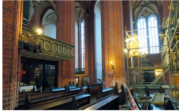
Neuer Gottesdienstort unter der Orgelempore

Das nächste Jahr hält für die Nikolaikirche eine zusätzliche Herausforderung bereit: das Gerüst wandert drei Joche weiter und steht damit mitten in der Mitte. Wir können von Glück reden, dass wir Martin Poley haben, der sehr unaufgeregt nach der besten Lösung sucht, Gottesdien- ste und Veranstaltungen weiter gut statt- finden lassen zu können. Sie dürfen ge- spannt sein!