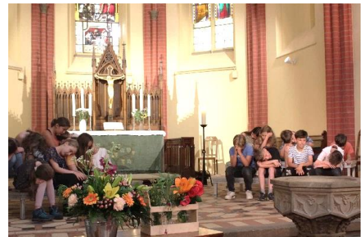
Lieder aus aller Welt. Die Dschungeltiere müssen auch mal schlafen, bevor der Papierdrache sie weiterträgt. Am 30. September wird das Programm noch einmal zu hören sein, nämlich in der Dorfkirche in Klink.