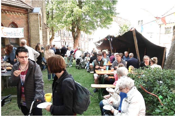
Am Kuchenbuffet hatten die Helferinnen alle Hände voll zu tun.