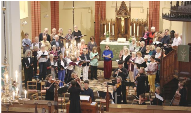
Kantatengottesdienst am 18. Juni im Rahmen der Warener Musiktage mit der Dienstagskantorei und Gästen

Di 10-11.30 Uhr Schmetterlingshaus, Bonhoeffer Str. 6