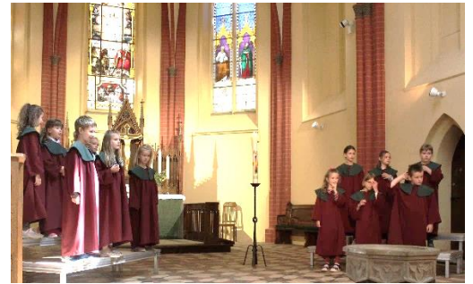
Die Jüngsten der Georgensingschule gestalteten die Andacht mit.