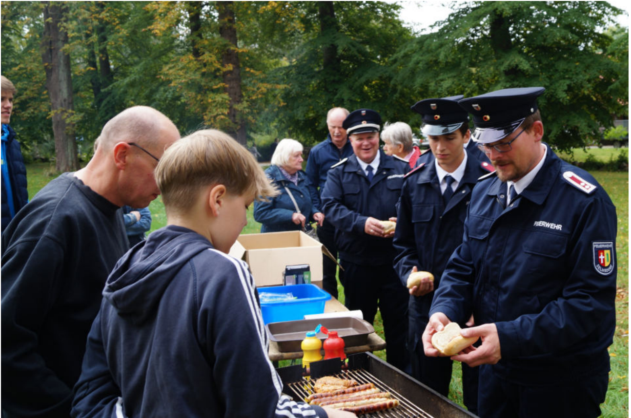
Auf dem Erntedankfest