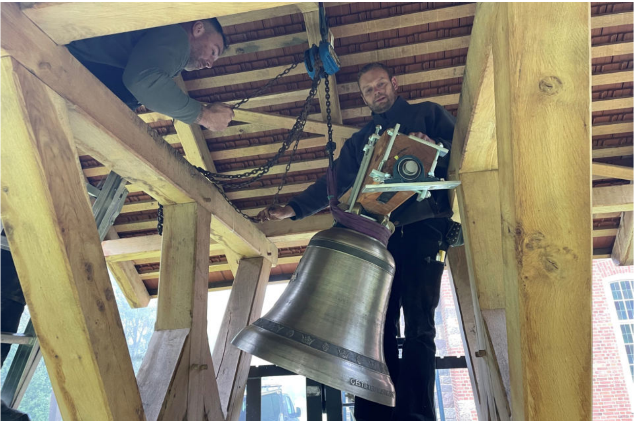
Der Einbau der Glocke