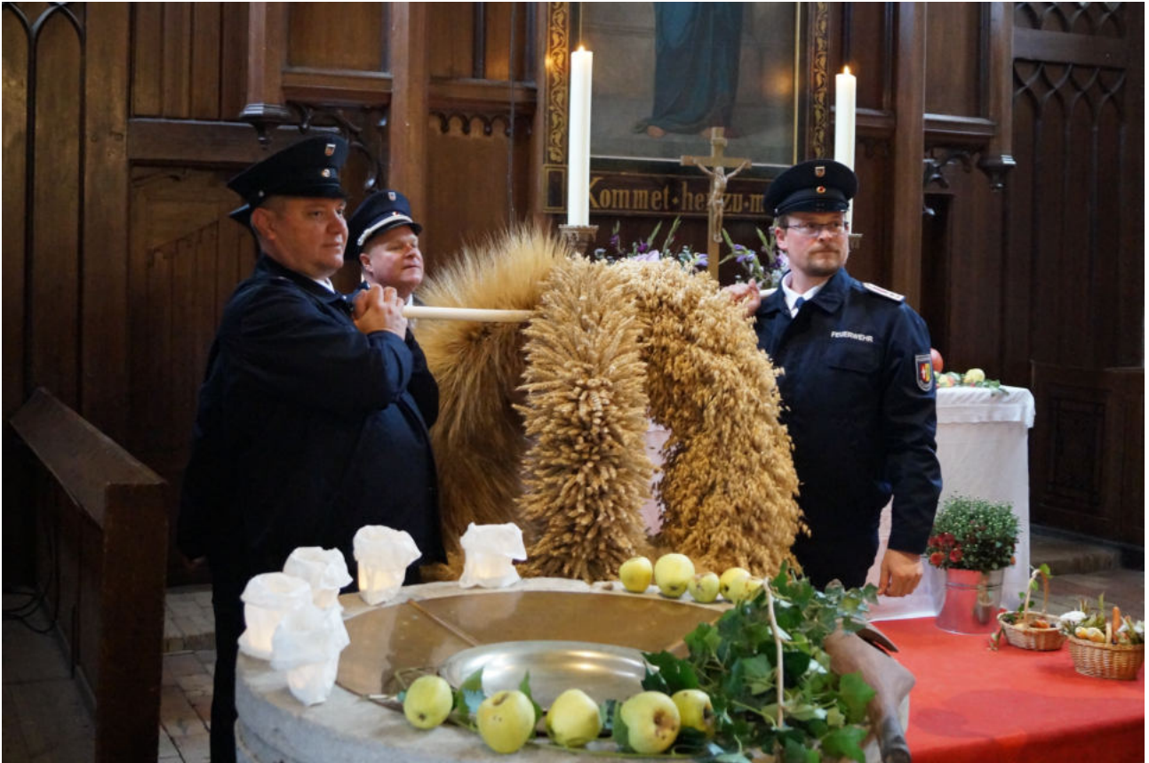
Das Erntedankfest mit Glockenweihe