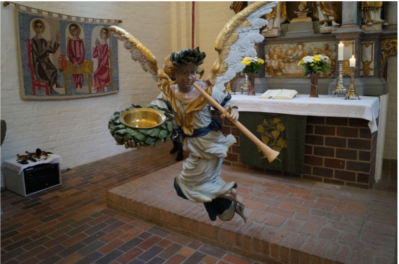
Der Taufengel in der Kirche Döbbersen