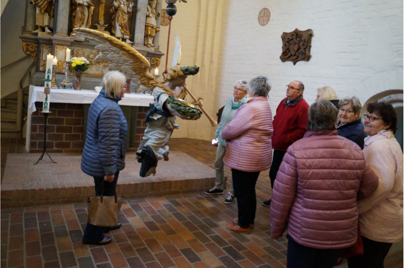
Auf Seniorenfahrt in Döbbersen