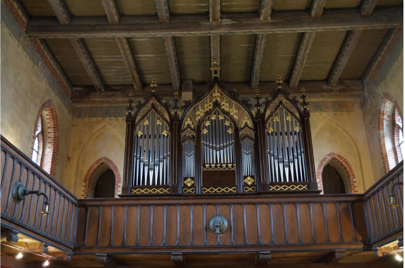
Orgel der Sankt Marienkirche in Selmsdorf.