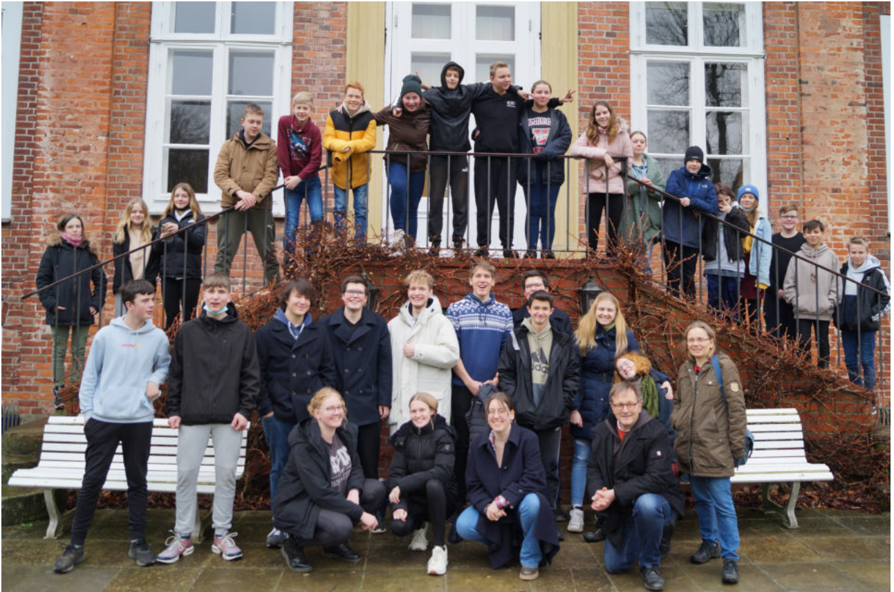
Vorkonfirmandenfreizeit der Kirchenregion Grevesmühlen im Januar in Dreilützow.