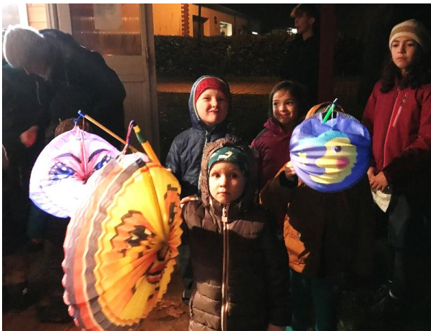
Martinstag in Carolinenhof