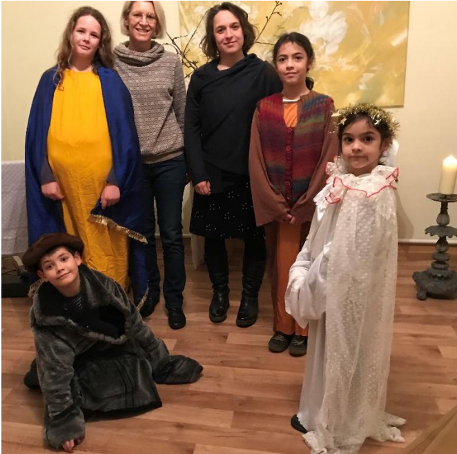
Krippenspielprobe in Schloen