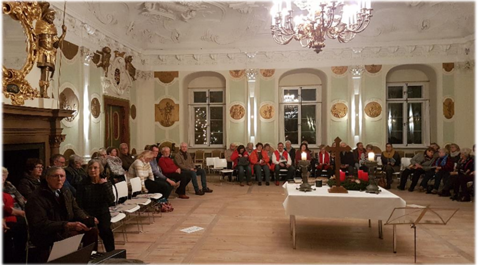
1. Advent 2019 in Hohen Luckow

Am 1. Advent, 3. Dezember feiern wir gemeinsam mit Chorsängerinnen und Chorsängern aus Neukirchen, Bernitt und Schwaan einen festlichen musikalischen Adventsgottesdienst am Kamin im Schloss Hohen Luckow. Viele von ihnen und bestimmt auch treue und neue Besucher dieses Höhepunktes freuen sich schon lange auf dieses besondere Klangerlebnis.