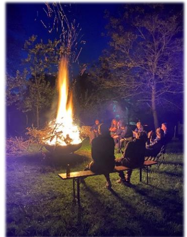
Mit den Pfadfindern kommt abends meistens die Konzentration auf die Mitte und dann der Blick in die Ferne.

Mögen auch Sie Mut und Hoffnung schöpfen, wo Sie es dringend brauchen.