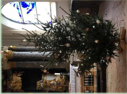
Kirche Hohen Luckow