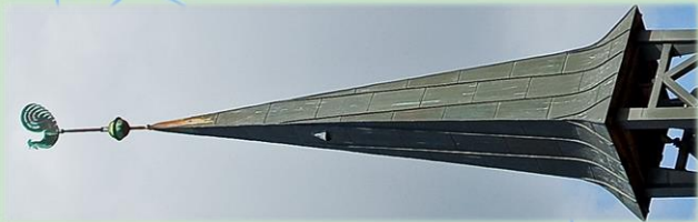
Kirche Hohen Luckow