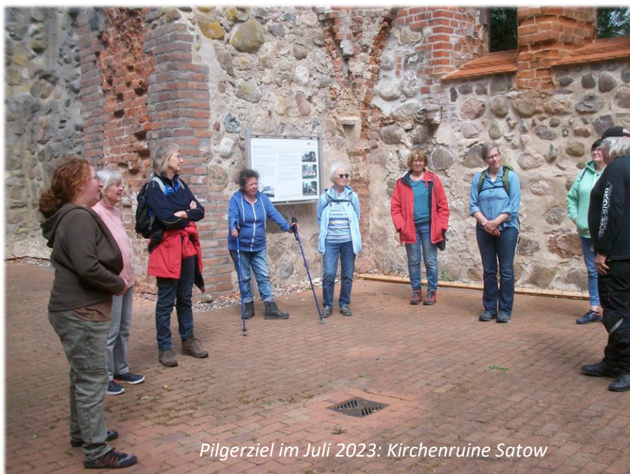
Pilgerziel im Juli 2023: Kirchenruine Satow

Was haben wir bei diesen Gelegenheiten nicht alles schon bestaunen können!