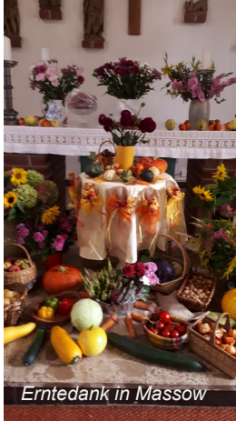
Erntedank in Massow

Stattdessen sind unsere Augen und Ohren auf die angstmachenden Nachrichten (Notvorrat, Krieg, Corona/Seuche, Teuerung ...) ausgerichtet. Sie wollen uns in Unruhe halten und den inneren Frieden rauben. Fast alle Gespräche drehen sich um diese Themen.