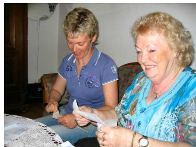
Die Wahlhelfer beim Auszählen der Stimmen