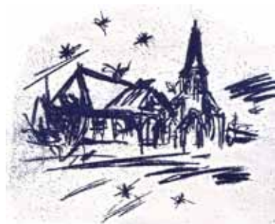
Grafik: Mirko Grunewald