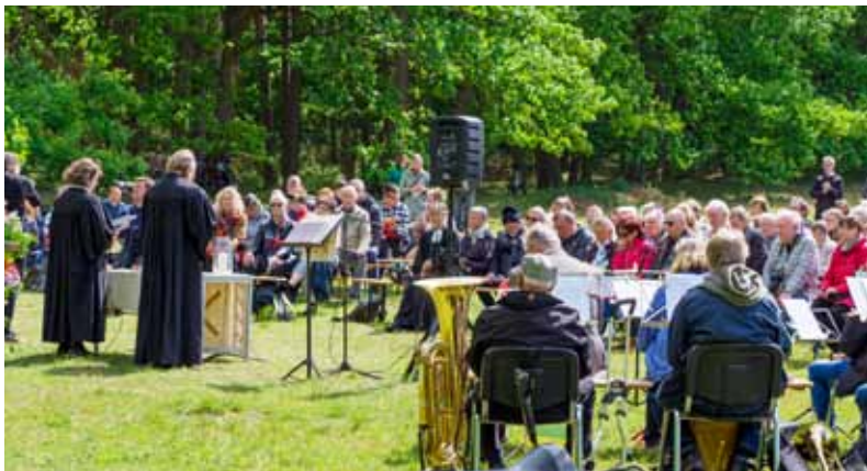
Himmelfahrt in Kösterbeck 2019