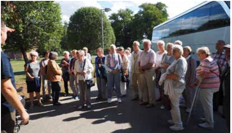
Ausflug nach Hohen Luckow im September 2022

Ausflug 4. Mai 13.00 Uhr nach Belitz und Teterow