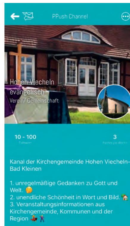
PPush-Kanal „Hohen Viecheln evangelisch“.

Schon lange ist die Homepage der Kirchengemeinde ein Ankerplatz für Ewiges und Aktuelles: kirche-hv.de Als neuen Ort führen wir nun die App der Kirchengemeinde ein. Unter dem PPush-Kanal „Hohen Viecheln evangelisch“ finden sie und findet ihr nun aktuelle Infos und regelmäßig gute Gedanken, Schönheit der göttlichen Welt in Wort und Bild auf dem Smartphone. Mehr Infos zur Installation der App „PPush“ finden Sie auf der Homepage.