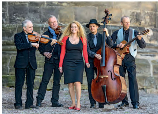
The String Company.

Kompositionen und temperamentvolle Arrangements: Die Musiker präsentieren Swing und Jazz aus Nordamerika, Celtic Folk aus Irland, Gipsy Swing aus Frankreich und Soul aus Skandinavien.