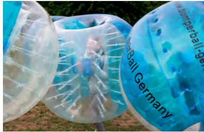
Konficamp in Sassen 2019.

Liebe Konfirmanden, wenn alles klappt, geht und sein darf, wollen wir vom 11. bis zum 13. Juni zum Konficamp nach Sassen aufbrechen. Ein Wochenende Zusammensein mit anderen Konfirmandinnen und Konfirmanden aus Mecklenburg und Pommern. Übernachtung in Zelten, viel Musik, Spiel, Spaß und Gemeinschaft erwarten Euch! Habt Ihr Lust, mitzukommen? Dann meldet Euch bei Eurer Pastorin, Eurem Pastor an.