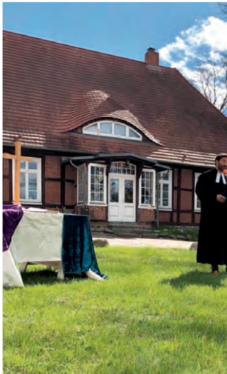
Gottesdienst unter weitem Himmel.

Wir nehmen die freundlichen Rückmeldungen auf und ergänzen das gottesdienstliche Programm im Sommer durch die Andacht „Feuer und Flamme“, die in den Sommermonaten an Samstagabend-Terminen stattfinden wird.