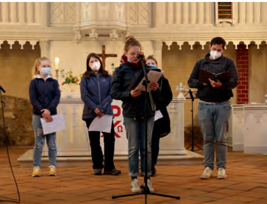
Vorstellung der Konfirmand*innen beim Himmelfahrtsgottesdienst der Unterregion in der Beidendorfer Kirche am 13. Mai 2021.