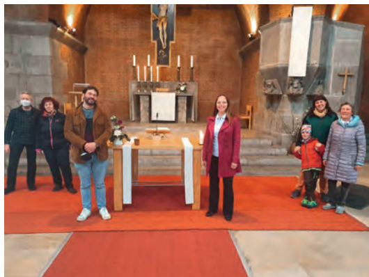
Freundlicher Empfang in Bamberg.