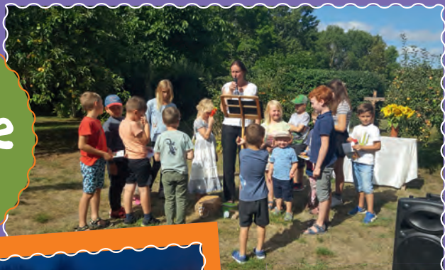
Schulanfangsgottesdienst in Dambeck.