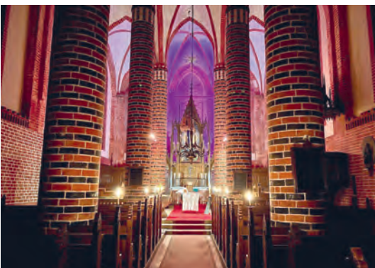
Der Altarraum besonders beleuchtet.