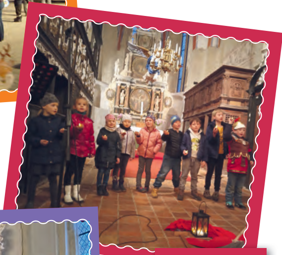
St. Martin in Lübow.