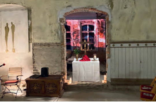
Valentinstag im Gutshaus.

am Dienstag, dem 14. Februar, in Niendorf