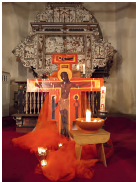
Taizé-Andacht in Dorf Mecklenburg.

Donnerstag, 8. Dezember, Dienstag, 31. Januar, Dienstag, 7. März, jeweils 18.00 Uhr in der Kirche