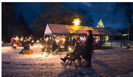
Heilig Abend auf dem Pfarrhof.

Arche klassisch, warm und drinnen und um 17.00 Uhr auf dem Pfarrhof mit Glühwein, Punsch und Krippenspiel. Um 22.00 Uhr feiern wir wieder eine besonders besinnliche Christnacht in der Kirche.