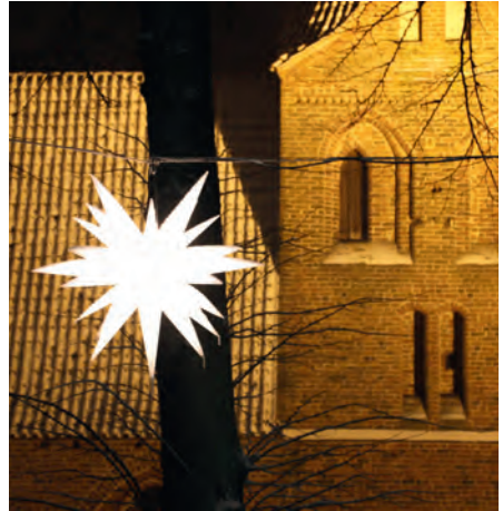
Adventssterne in Dorf Mecklenburg.

Am Freitag vor dem 4. Advent laden wir ein zur Adventsandacht an der