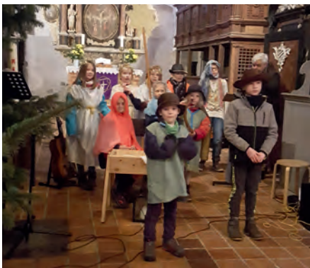
Krippenspiel in Lübow.

Am 4. Advent (17. Dezember) um 14.30 Uhr führen Kinder in Lübow das Krippenspiel auf. Wir laden herzlich in die Kirche und im Anschluss zur Begegnung auf dem Platz vor dem Pfarrhaus ein.