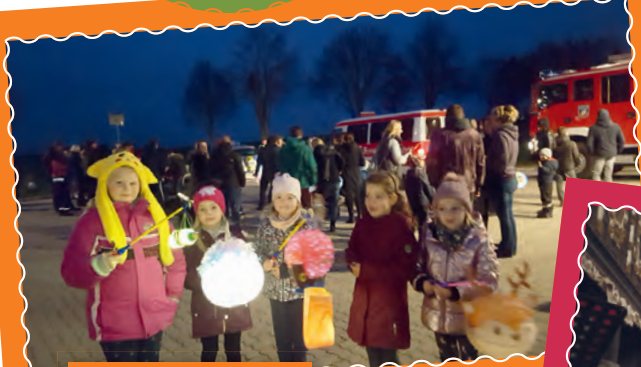
An der Feuerwehr in Hohen Viecheln. Alle warten gespannt, wann der Umzug endlich losgeht.