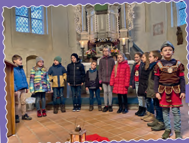
St. Martin in Dambeck.