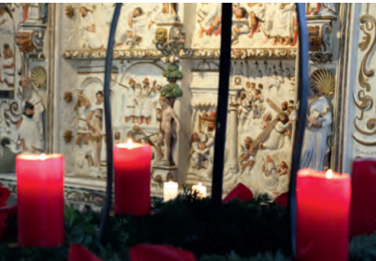
Adventskranz Kirche Dorf Mecklenburg.

Am Samstag, dem 3. Dezember, findet ein Weihnachtsmarkt auf dem Pfarrhof und in der Pfarrscheune statt. Es wird ein abwechslungsreiches Programm auf der dortigen Bühne und in der Kirche angeboten. Kunsthandwerker bieten ihre Waren an und auch für das leibliche Wohl ist gesorgt.