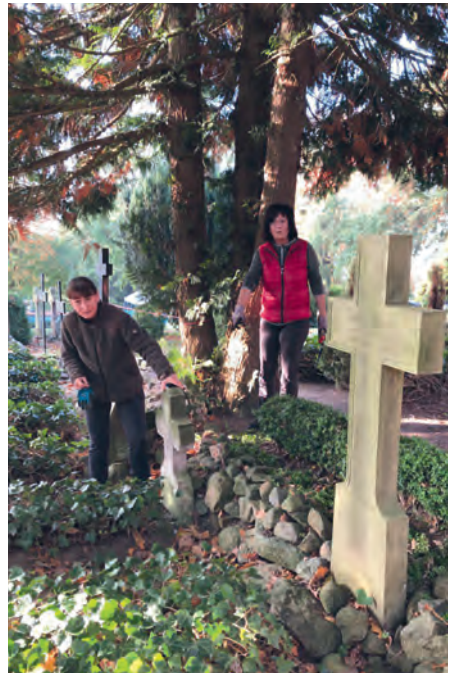
Frisch gepflegte Pastorengräber.

„Wie ein Gottesdienst“ wurde der diesjährige – erste – Herbstputz um Kirche und Pfarrhaus genannt. Gemeinsam, fröhlich, unter Einsatz aller Kräfte und mit meditativer Akribie wurden die Pastorengräber, die Gemeinschaftsanlage und die Weltkriegsgedenkstätte gepflegt, der Blick auf den See freigelegt und der neue „Ort zum Gedenken“ weiter vorbereitet. Vielen Dank allen, die dabei mitgemacht und sich gleich noch einen nächsten Termin im Herbst gewünscht haben!