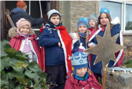
Sternsinger in Dorf Mecklenburg.

Auch 2023 werden die Kinderkirchengruppen als Sternsinger in Dorf Mecklenburg und Lübow unterwegs sein. Sie wollen Ihnen wieder den Segen und Freude bringen. Unter dem Motto: „Kinder stärken-Kinder schützen“ sammeln wir für Projekte, die Kinder vor der Gewalt, die sie oft erleben müssen, beschützen.