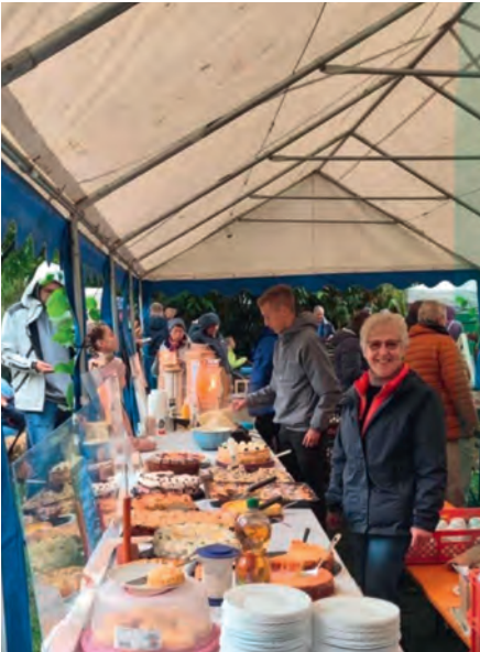
Bauernmarkt 2022.