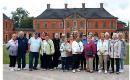
Gemeindeausflug zum Schloss Bothmer.

Wenn Menschen eine Reise tun, dann haben sie etwas zu erzählen. Vielleicht erzählten die Teilnehmer aus den Kirchengemeinden Dorf Mecklenburg und Dambeck-Beidendorf vom freundlichen Busfahrer, dem passenden Reisewetter, dem Gottesdienst in der Grevesmühlener Kirche, dem kleinen Extra, das sie sich nach dem ausgezeichneten Mittagessen in der Klützer Mühle gönnten, vom britischen Flair im Schloss Bothmer, das an diesem elften September, dem Tag es offenen Denkmals, Tore und Türen weit geöffnet hatte. Vielleicht erzählten sie auch von mancher Begegnung, von neuen Bekanntschaften und davon, wie schön es doch ist, gemeinsam unterwegs zu sein. Und sicher von der Vorfreude auf einen weiteren gemeinsamen Ausflug im kommenden Jahr.