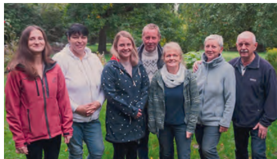
Der Kirchengemeinderat 2016 – 2022.

Der Redaktionsschluss dieses Gemeindebriefs lag vor der Auszählung der Wahl zum neuen Kirchengemeinderat. Sie erfahren das Wahlergebnis aber sobald es vorliegt über die Homepage, über die Schaukästen und über die App „PPush“ im Kanal „Hohen Viecheln evangelisch“