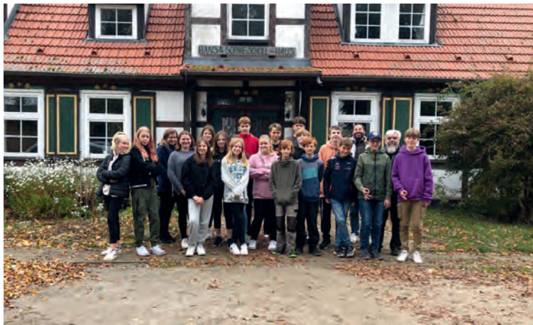
Konfi-Fahrt nach Sassen.