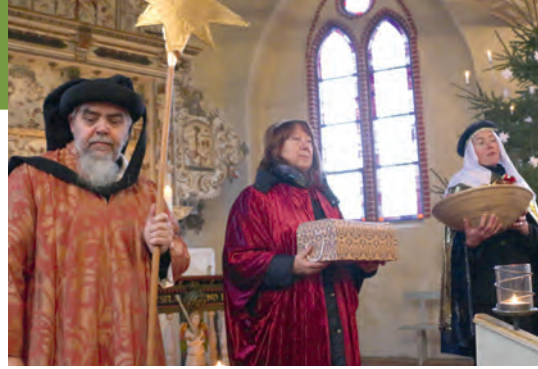
Gottesdienst zu Epiphania 2022.

Nach dem großen Erfolg im vergangenen Jahr feiern wir am 14. Februar wieder einen Abendgottesdienst zum Valentinstag. Um 19.00 Uhr öffnet das Gutshaus in Niendorf, zentral gelegen zwischen unseren Gemeinden, seine Pforten. Poesie und gute Gedanken weben sich um das Thema Liebe. Dazu hören wir besondere Musik, die das Herz erwärmt und ein Schmunzeln auf die Lippen zaubert. Dieser Abend ist für alle da, die sich lieb haben: Mit einem Menschen an der Hand oder im Herzen. Oma und Enkel, frisch verliebte Teenager, frisch verliebte Mittfünfziger, Geschwister und natürlich die Paare, die sich im vergangenen Jahr ihr „Ja“ gesagt haben. Und nicht zuletzt für alle, die gerade niemanden haben außer die Liebe selbst.