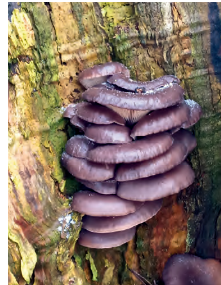
Entdeckt in der Landschaft um Lübow.

Für den Imbiss bringe bitte jeder etwas für sich und seine Familie mit, so dass alle auch gut versorgt sind. Unterwegs werden wir innehalten und gemeinsam singen und beten. Es besteht auch die Möglichkeit, im letzten Teil der Strecke, die ca. 6 km lang sein wird, von einem Fahrzeug abgeholt zu werden.