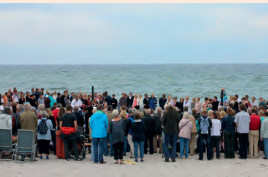
Taufest in Rerik 2015.

Am Palmsonntag laden wir zur Wanderung nach Lübow ein. Weitere Informationen finden Sie auf Seite 16.