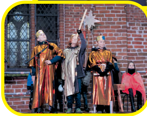
Krippenspiel in Dorf Mecklenburg vor der Kirche

2020 mussten wir ungewöhnliche Wege gehen. In Bad Kleinen fand das Krippenspiel ohne Zuschauer statt, in Lübow ohne Kinder, nur mit Texten und Musik. Und in Dorf Mecklenburg und Beidendorf hatten wir keinen Platz im geschützten Raum der Kirchen. Wir mussten im Freien spielen. Trotzdem war es schön.