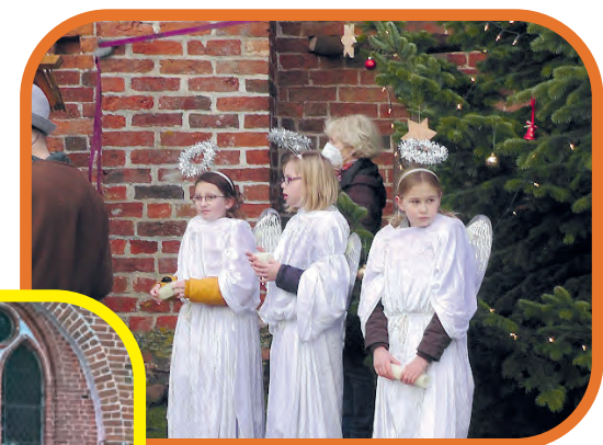
Krippenspiel in Beidendorf vor der Kirche