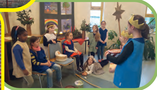
In der Arche in Bad Kleinen, leider ohne Zuschauer