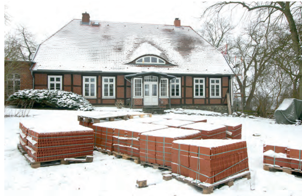
Pfarrhaus in Hohen Viecheln

Allen beteiligten Firmen und ihren Mitarbeiter*innen, dem Planungs-