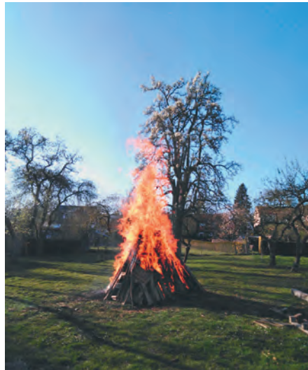
Osterfeuer in Dorf Mecklenburg. Für Getränke ist auch dieses Jahr gesorgt.

Sonntag, 4. April, 19.00 Uhr Sie sind, wenn die Bedingungen es uns erlauben, herzlich eingeladen zum Osterfeuer im Pfarrgarten.